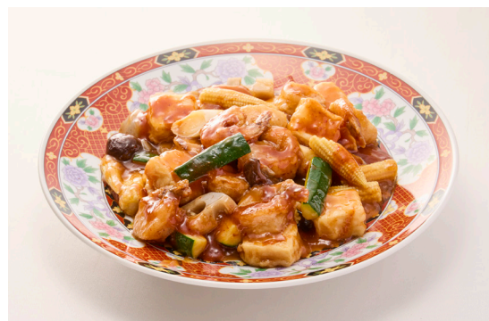
海老と揚げ出し豆腐のピリ辛煮