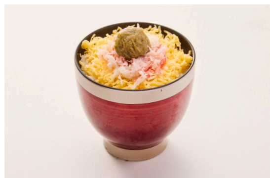
蟹の炊き込みご飯