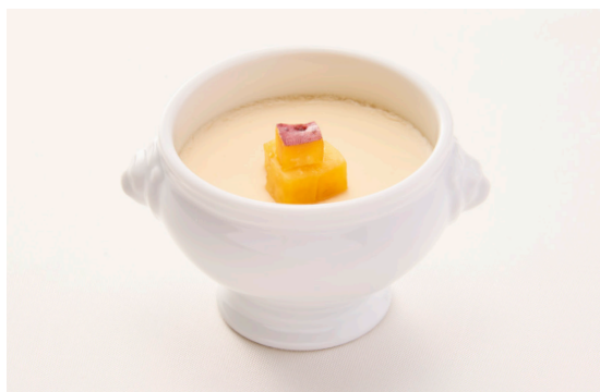
さつま芋のポタージュ