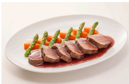
牛タンの赤ワイン煮込み